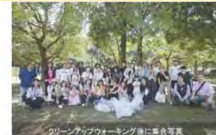
クリーンアップウォーキング後に集合写真

での約2kmを歩きながら、落ちているゴミを拾う「クリーンアップウォーキング」を行いました。この奉仕活動は今回が通算4回目となり、同地区内の浦和、与野、大宮、岩槻エリアにて活動。今後は上尾や戸田まで範囲を広げていく予定です。